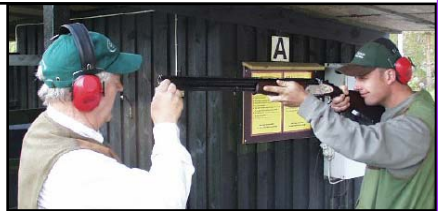
Her checkes det om haglbøssen's passer.